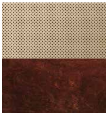
Kem / Ivory (Semi-aniline) Ốp gỗ Walnut / Walnut wood