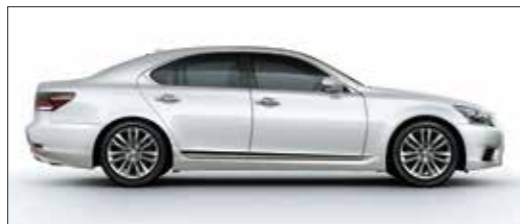
Trắng ngọc trai / White Pearl Crystal Shine <077>