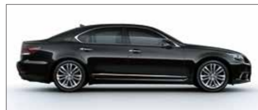
Đen / Black <212>