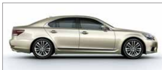
Nâu nhạt ánh kim / Sleek Ecru Metallic <4U7>