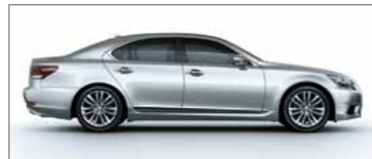
Bạc sáng / Sonic Silver <1J2>