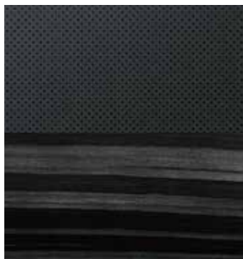
Đen / Black (Semi-aniline) Ốp gỗ Shinamoku / Shinamoku wood