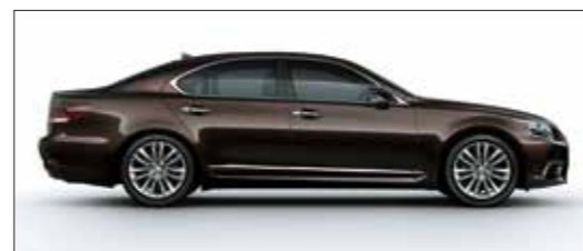
Nâu sẫm mã não / Fire Agate Mica Metallic <4V3>