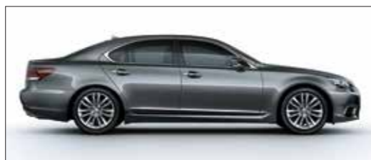
Xám thủy ngân / Mercury Gray Mica <1H9>